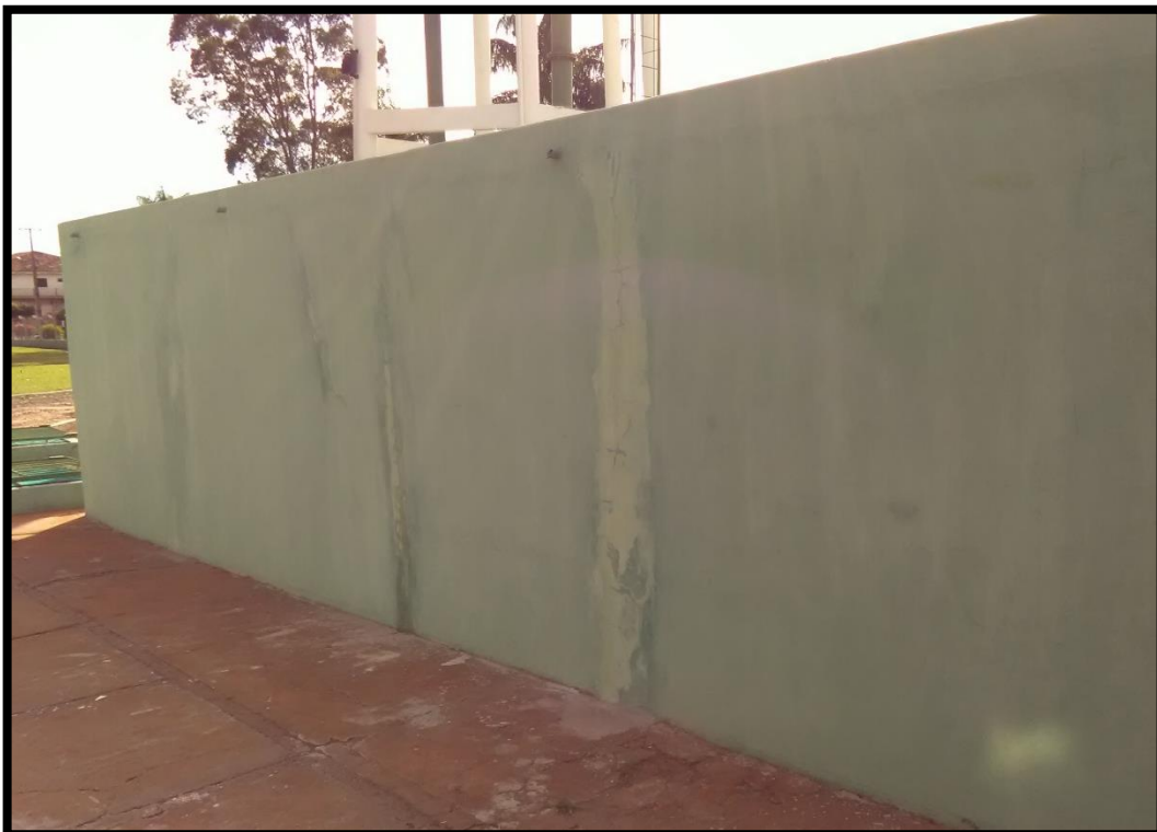
Imagem 12: Reservatório semienterrado 2