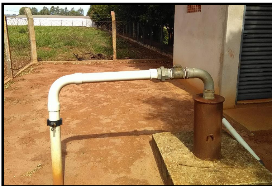
Imagem 07: Poço 9

Quanto as 'não conformidades' apontadas para as captações no relatório de fiscalização de 2019, segue a situação verificada nesta fiscalização: