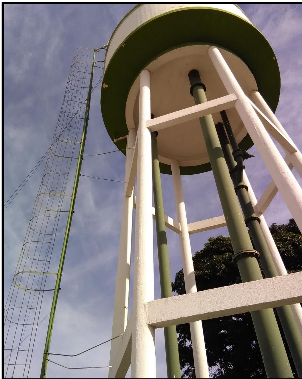
Imagem 13: Reservatório semienterrado 2

Quanto as 'não conformidades' apontadas para os Reservatórios no relatório de fiscalização de 2019, segue a situação verificada nesta fiscalização: