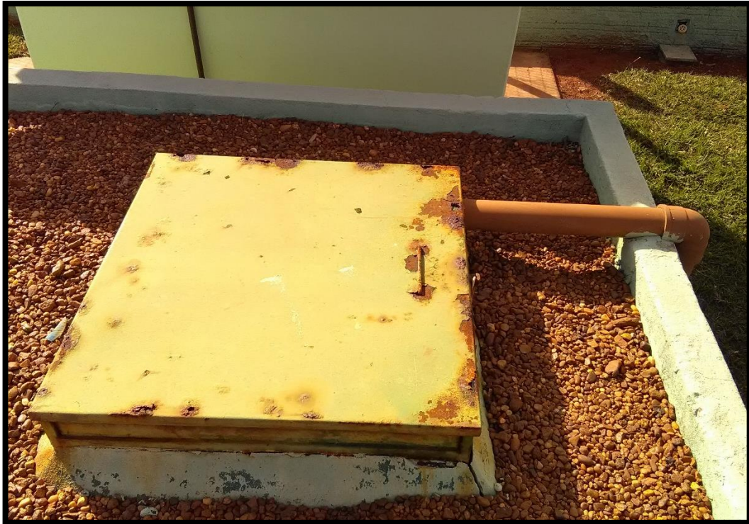
Imagem 11: Abertura de inspeção do reservatório semienterrado 1