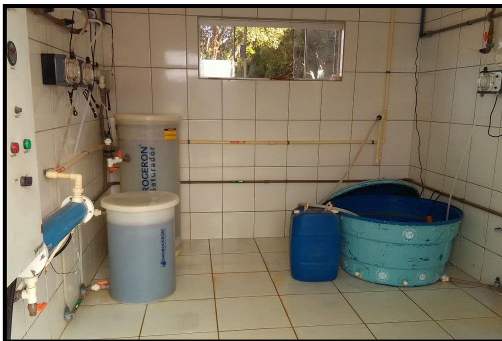
Imagem 08: Bombas dosadoras e reservatórios de solução