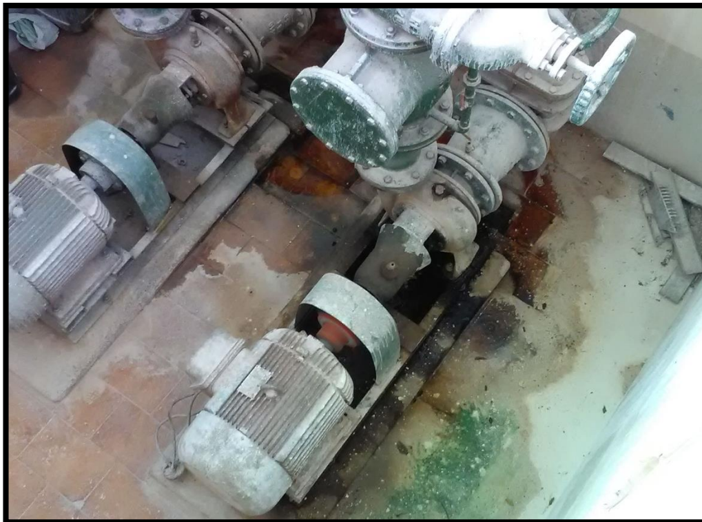
Imagem 14: Conjunto moto-bombas da elevatória