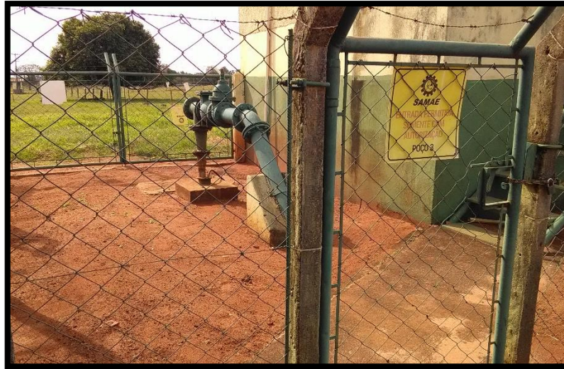
Imagem 03: Poço 3