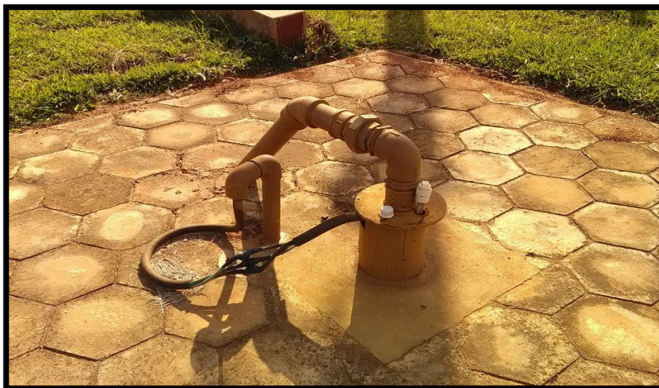
Imagem 06: Poço 8