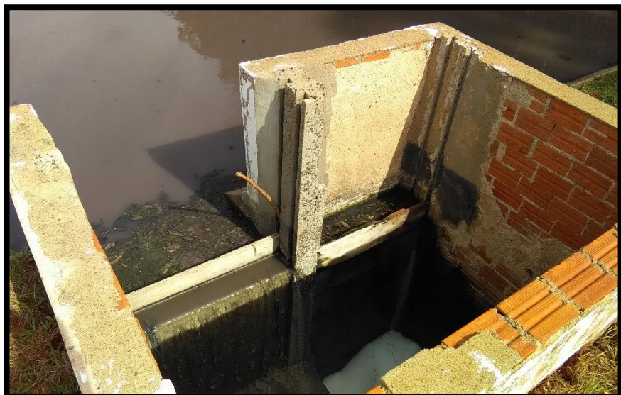
Imagem 23: Dispositivo de saída da lagoa facultativa