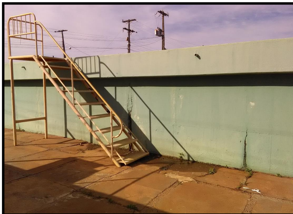
Imagem 10: Reservatório semienterrado 1