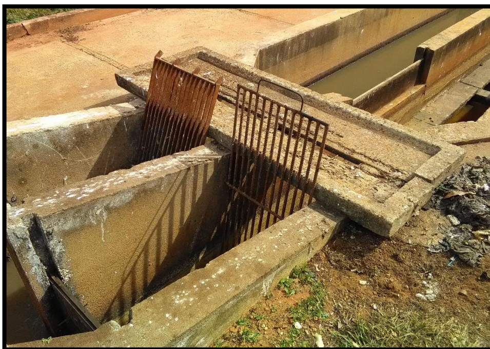
Imagem 20: Tratamento primario