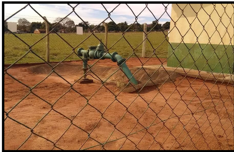
Imagem 04: Poço 4