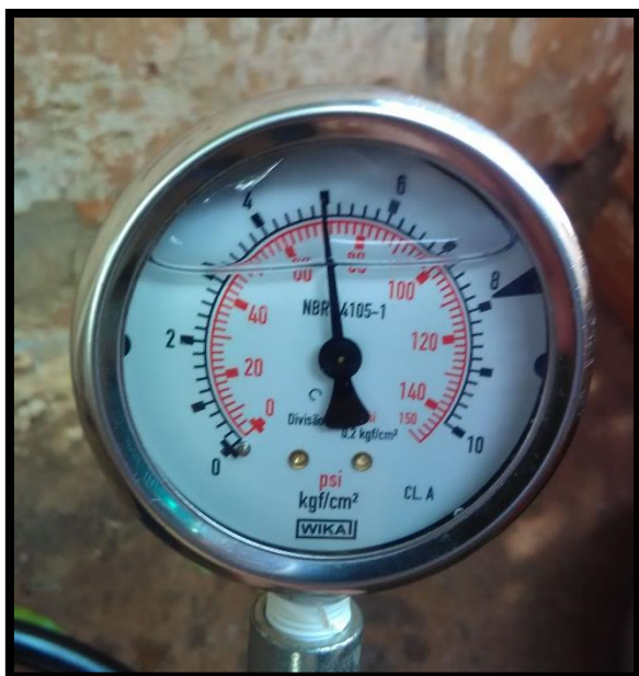
Imagem 18: Medição Av Expedicionarios