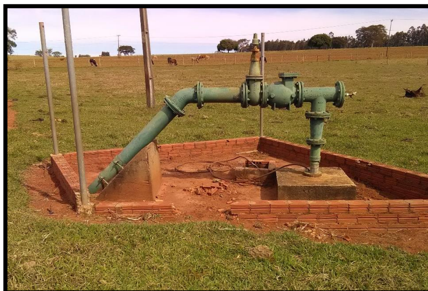
Imagem 02: Poço 2