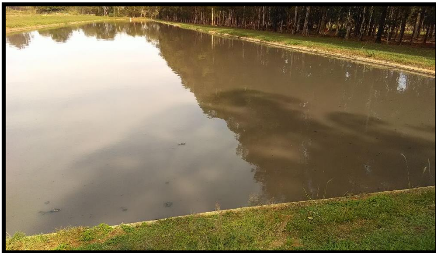
Imagem 22: Lagoa anaeróbia 2