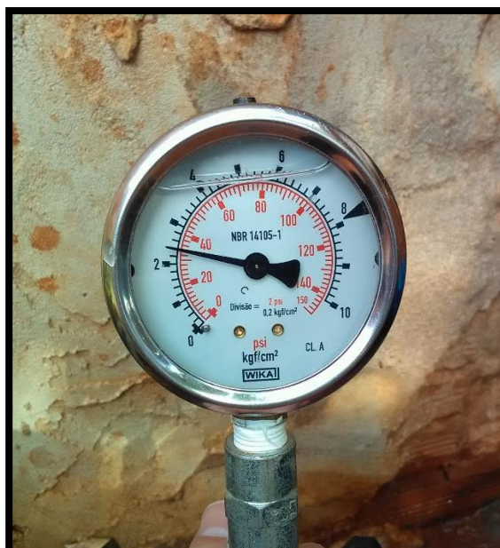
Imagem 19: Medição Rua Julio Savoldi