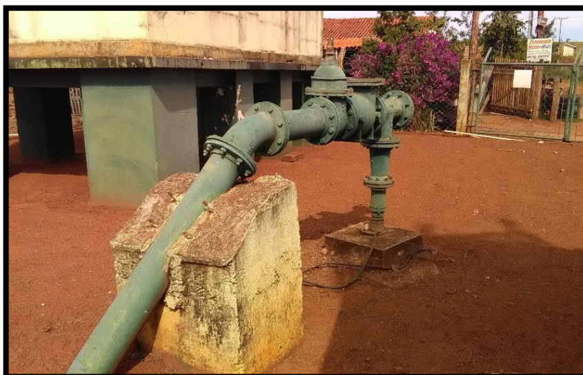
Imagem 01: Poço 1

Atualmente, os poços operantes da área urbana são: Poço 1, Poço 2, Poço 3, Poço 4, Poço 7, Poço 8 e Poço 9. Segue imagens: