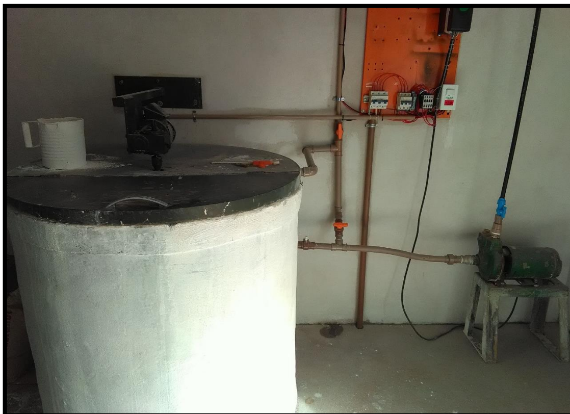
Imagem 09: Unidade de correção de pH

Quanto as unidades de tratamento de água: não foram verificadas 'não conformidades'.