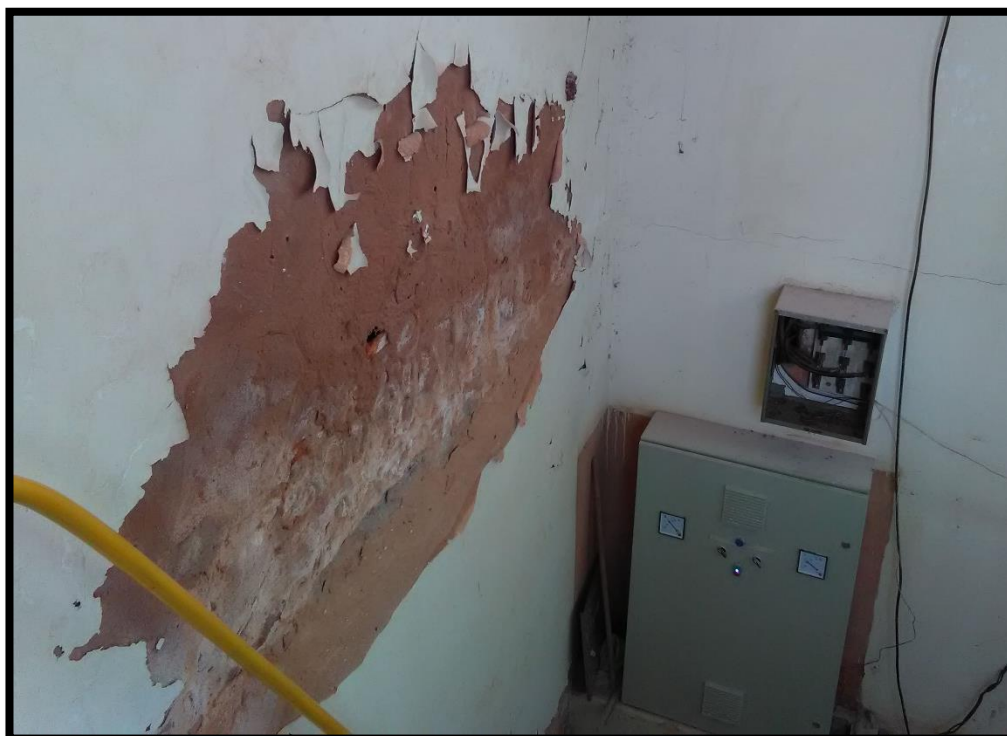
Imagem 15: Quadro de comando