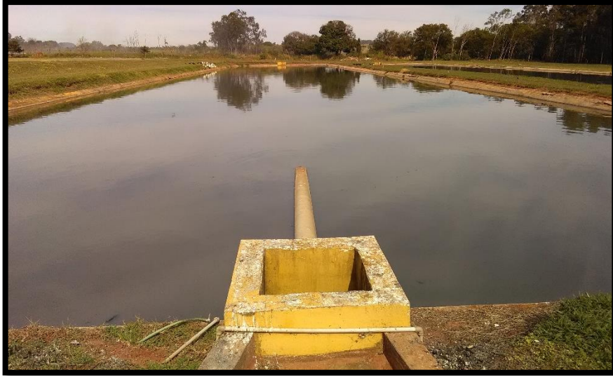
Imagem 21: Lagoa anaeróbia