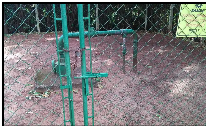
Imagem 05: Poço 7