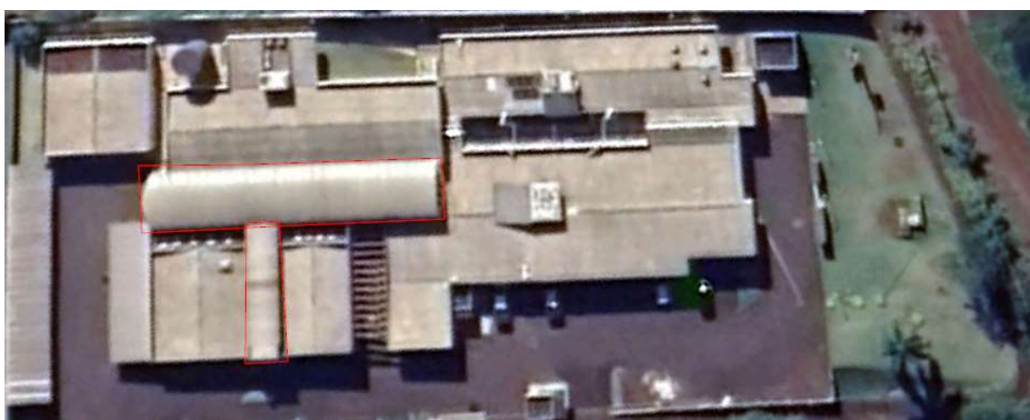
Figura 2 - Imagem aérea